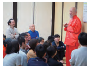
呼吸法、瞑想法など